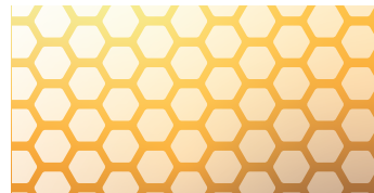
全合成油 不純物が無く、高い潤滑性能を発揮

原油を高度な技術と行程を経て造り出されたものや、可能な限り不純物を除去し精製したエンジンオイルの事です。性能は、鉱物油、部分合成油に対して圧倒的で、レーシングカーのエンジンには、必ずフルシンセティックオイルが使用されています。