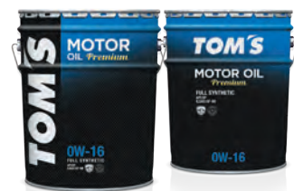
0W-16 FULL SYNTHETIC API:SP / ILSAC:GF-6B (PAO配合)

API SP / ILSAC GF-6規格の中で最も厳しい省燃費基準をクリア。最新ハイブリッド車に最適なハイクオリティ&ハイパフォーマンスエンジンオイルです。