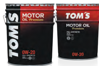
0W-20 FULL SYNTHETIC API:SP / ILSAC:GF-6A (PAO配合)

省燃費性能、耐久性、エンジンの保護性能を強化。0W-20指定のハイブリッド車はもちろん、ダウンサイジングターボ車にもマッチ。もちろん環境にも優しいエンジンオイルです。