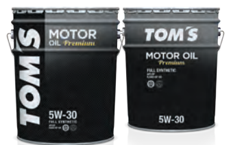
5W-30 FULL SYNTHETIC API:SP / ILSAC:GF-6A

最新のエンジンに要求される酸化安定性、清浄分散性、摩耗防止性基準をクリアした、ハイパフォーマンスエンジンオイル。5W-30指定のダウンサイジングターボ車に最適なオイルです。