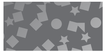
鉱物油 不純物が多いので、潤滑性能や耐久性が劣る