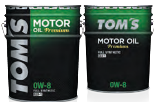
0W-8 FULL SYNTHETIC JASO:GLV-1 (PAO配合)

超低粘度油規格であるJASO GLV-1を取得し、省燃費性能とエンジン保護性能を高いレベルで両立させたハイパフォーマンスエンジンオイル。0W-8指定車の燃費性能を最大限引き出すオイルです。